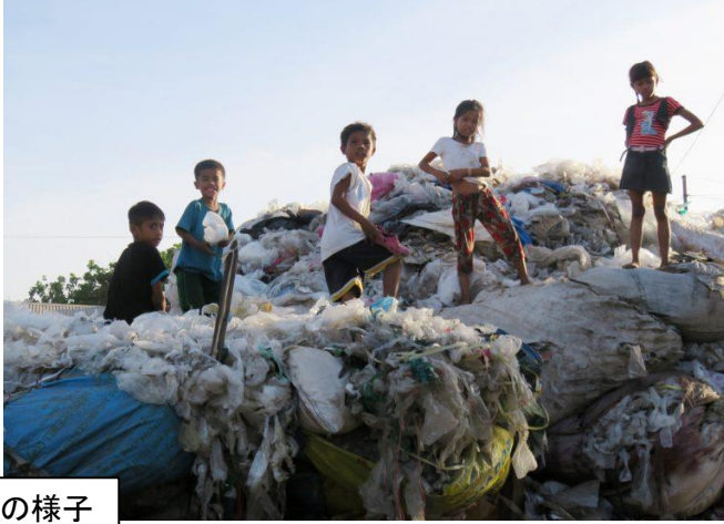
フィリピンの様子